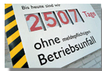
Zur Registrierung von Arbeitsunfällen ist ein neues, durch die Anordnung des Arbeitsministers Nr. 755/2006 genehmigtes Formular eingeführt worden.

Auch die Bestimmungen bezüglich der Meldung, Untersuchung, Registrierung, Erforschung, etc. von Arbeitsunfällen ( accidente de munca ) und Berufskrankheiten ( boli profesionale ) sind in den Anwendungsvorschriften enthalten. Hinzuweisen ist darauf, dass auch hier eine Vielzahl von Formblättern und Register (allein im Bereich der Arbeitsunfälle gibt es vier Register, in welche die Unfälle je nach deren Art einzutragen sind) geregelt werden. Zur Registrierung von Arbeitsunfällen ist darüber hinaus ein neues, durch die Anordnung des Arbeitsministers Nr. 755/2006 genehmigtes Formular („FIAM“) eingeführt worden.