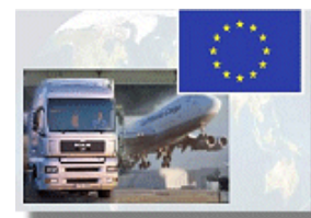
Die neuen Bestimmungen schaffen die Pflicht zur jährlichen Anvisierung des Zertifikates nach Ablegung eines Multiple-Choice-Testes ab.

In demselben Amtsblatt Nr. 570 vom 20.08.2007 wurden die rumänischen Vorschriften im Bereich Transportwesen an das Europäische Abkommen über den Transport von gefährlichen Gütern (gekürzt: EATGG) angepasst. Hierfür wurde durch Erlass der Anordnung Nr. 640 vom 20.08.2007 die ältere Anordnung Nr. 82/1995 aufgehoben.