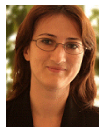
Av. Oana Someșan