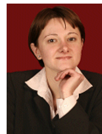
Av. Dr. Raluca Oprisiu

Bitte informieren Sie uns, wenn Sie RECHTS-INFORMATION RUMÄNIEN nicht mehr beziehen möchten.