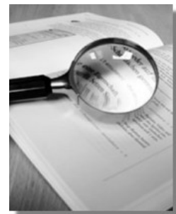
Betriebsstätten einer im Ausland ansässigen juristischen Person sind ebenfalls zur Aufstellung von Jahresabschlüssen und periodischen buchhalterischen Berichten nach dem rum. Buchhaltungsgesetz verpflichtet.

- Gewinne oder Verluste, die aus bestimmten Operationen mit Eigenkapitalinstrumenten resultieren werden in der Gewinn- und Verlustrechnung nicht berücksichtigt. Sie werden direkt im Eigenkapital verbucht und in der Bilanz besonders dargestellt.