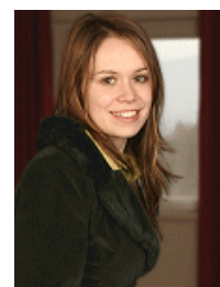
Av. Andrada Sarb