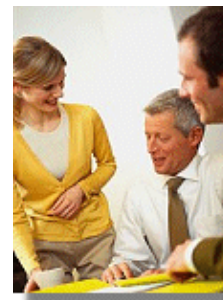
Betroffen vom Gesetz Nr. 467/2006 bzgl. Unterrichtung und Anhörung von Arbeitnehmern sind alle in Rumänien ansässigen Unternehmen ab einer Mitarbeiteranzahl von 20.

„Arbeitserlaubnisse benötigen grundsätzlich sowohl bei rumänischen Arbeitgebern beschäftigte Ausländer als auch aus dem Ausland nach Rumänien entsandte Arbeitnehmer ausländischer Arbeitgeber.“